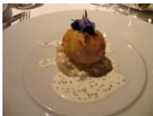
ŒUF DORÉ EN SURPRISE DE CAVIAR, FONDUE DE POMME DE TERRE ET CHOUX-FLEURS PAR SERGE CHOLET