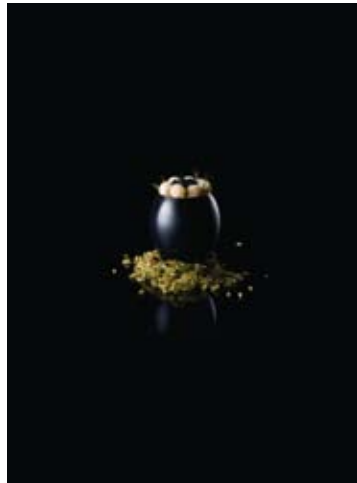
LES TROIS PHOTOGRAPHIES GAGNANTES DE SOPHIE ROLLAND