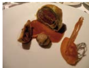
SUPRÊME DE PIGEON DE GRAIN, SAVEUR D'AUTOMNE PAR FRANCIS CHAUVEAU