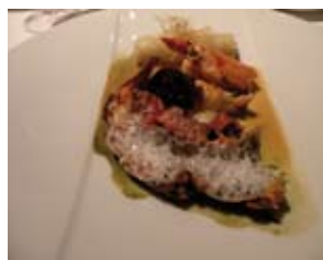
QUEUE ET PINCES DE HOMARD BLEU, COQUE DE LAIT DE COCO LÉGÈREMENT ÉPICÉ, CANNELLONI DE CÉLERI ET HARICOT PAR XAVIER MATHIEU