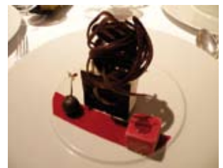
LE CLASSIQUE FORÊT NOIRE REVUE PAR LE MOULIN ET PAR RADHOUANE ZAITER