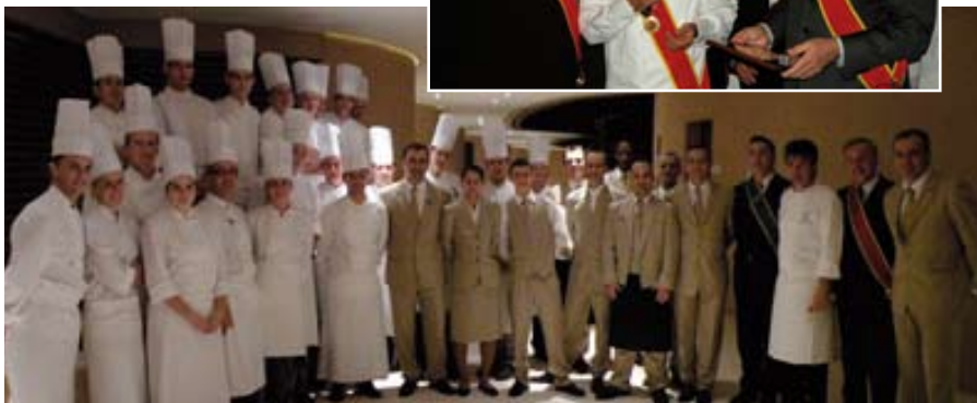
LES BRIGADES DE CUISINE ET DE SALLE DU GRAND-HÔTEL DU CAP-FERRAT